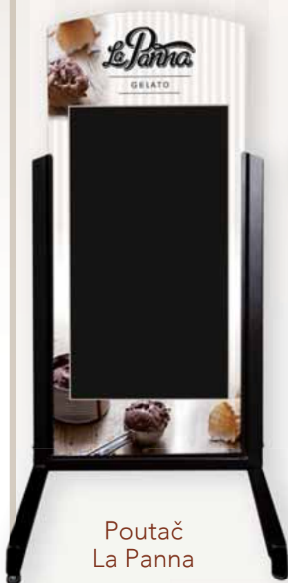
Poutač La Panna