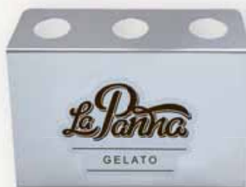
Držák na kornoutky La Panna