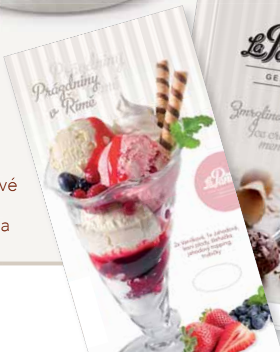
Zmrzlinové menu La Panna