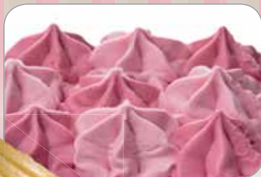
540023 Kornout Grand La Panna 1x 460 ks